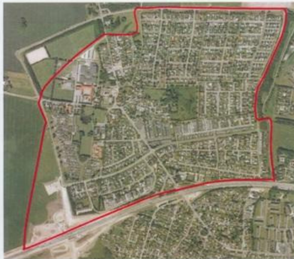
Figur: Kort over området der er omfattet af projektforslaget (Fløng)

Din ejendom beliggende [REDACTED] er omfattet af projektforslaget.