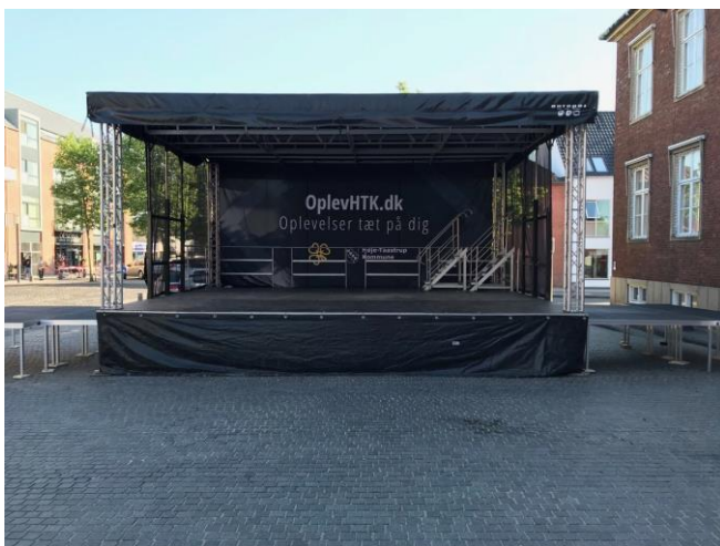
(mål ca: 10x6 meter – ex. Sideudvidelser)